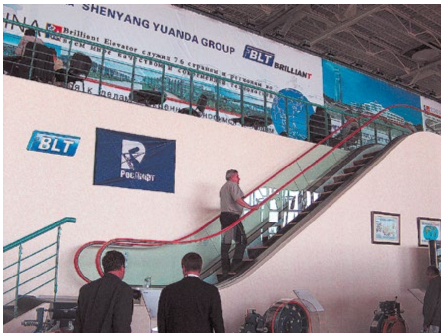
Экспозиция фирмы «Рослифт»

Надо отметить, что в последнем номере года была еще одна публикация о выставке в Аугсбурге: уже известный нам Сергей Чёрный обра-