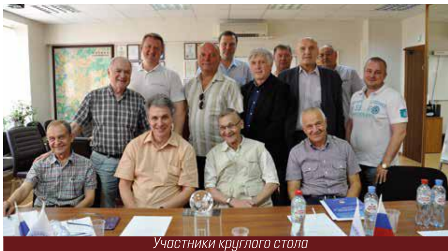
Участники круглого стола