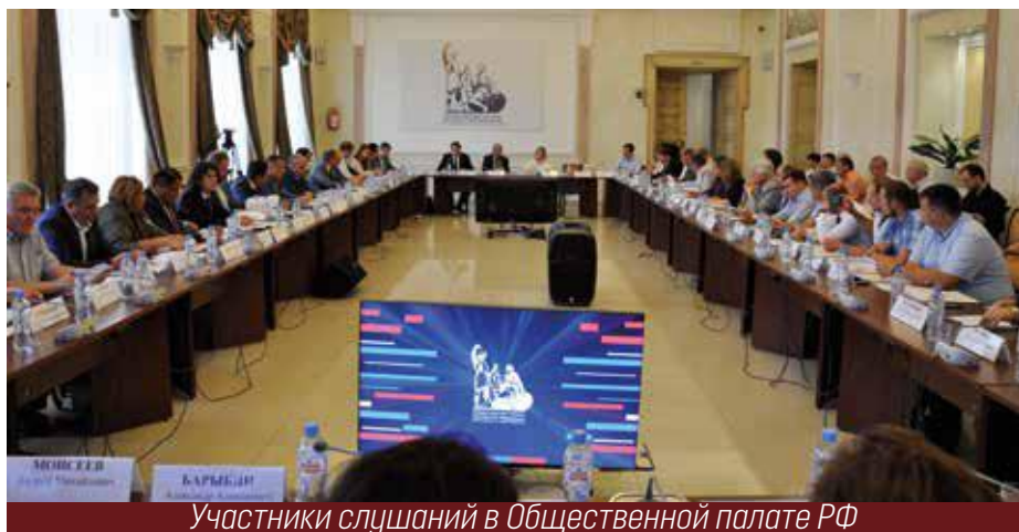
Участники слушаний в Общественной палате РФ

Юбилеи юбилеями, а главным событием года все равно стала очередная международная выставка лифтов и подъемного оборудования Russain Elevator Week-2019 (REW-19). Яркое, впечатляющее,