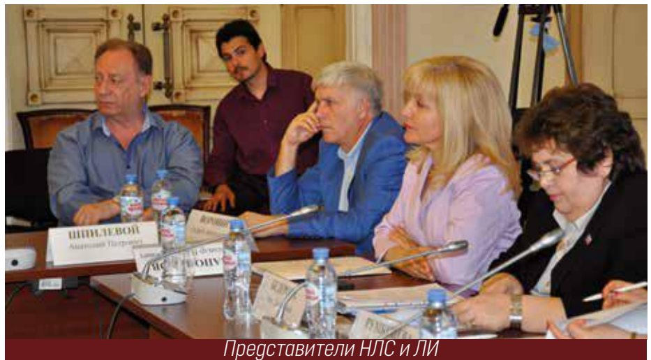
Представители НЛС и ЛИ

Уходит год, но не останавливается жизнь и не прекращается ни на секунду серьезная работа и острая борьба лифтовиков за свой престиж, за свое дело, за право обеспечить граждан страны комфортным и безопасным средством вертикального перемещения. И в этих горячих событиях, в их гуще всегда был, есть и будет наш журнал, единственный в стране журнал о лифтах, о лифтовиках и для лифтовиков.