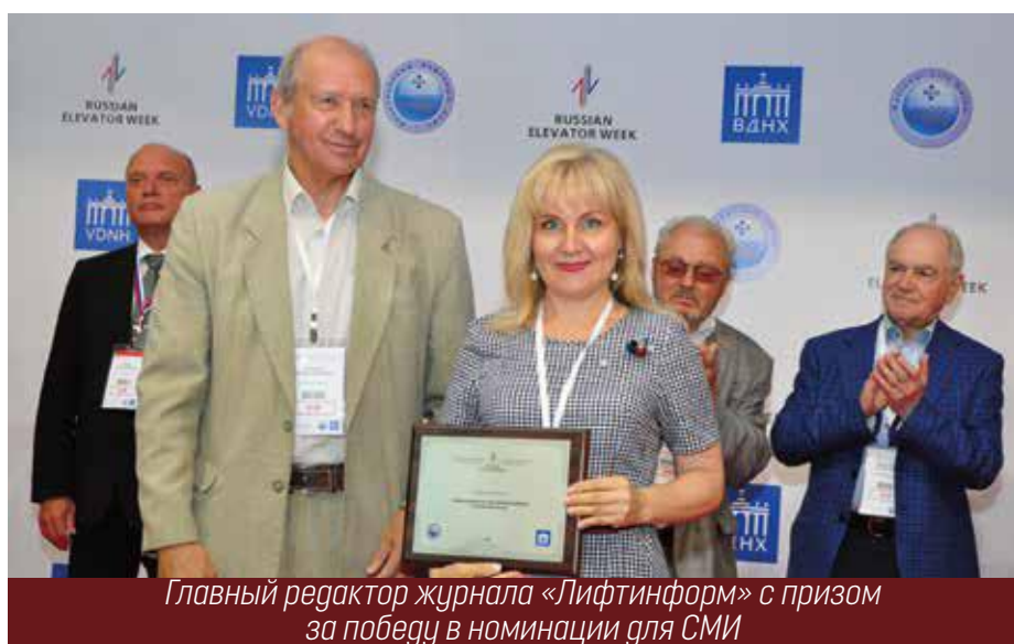
Главный редактор журнала «Лифтинформ» с призом за победу в номинации для СМИ