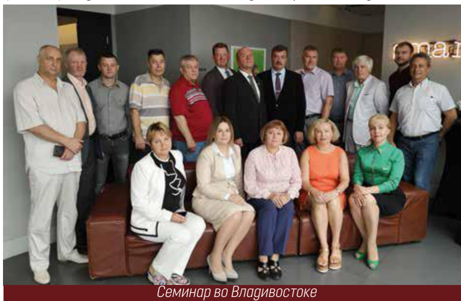
Семинар во Владивостоке

Но сказать о том, что всегда журнал старался дать возможность высказаться на его страницах всем, нужно и важно. Год, о котором мы сейчас рассказываем, стал своего рода годом подъема и падения, упущений и достижений. Одним из таких достижений оказалась, на первый взгляд, совершенно безобидная статья о том, почему и кем установлен срок службы в 25 лет для лифтов. По заданию ру-